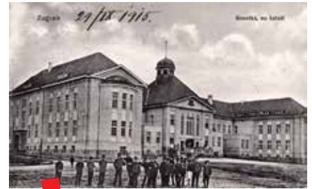
Plemički konvikt na Šalati, oko 1914.