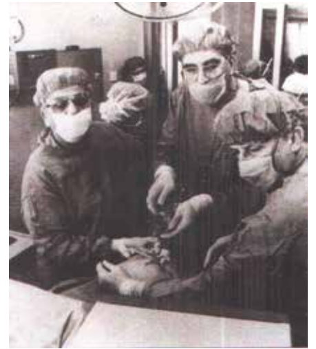
Slika 1. Prva laparoskopjska kolecistektomija u Hrvatskoj

Operacija je protekla uspješno, bez ijedne komplikacije. Iznimno je važna bila podrška cijelog tima jer se počinjalo s nečim sasvim novim. Takav je operacijski tijek ohrabrio kirurge te su nastavili s rutinskim izvođenjem LK-a bez probiranja bolesnika. Nekoliko dana nakon operacije u bolnici „Sveti Duh“ učinjen je LK u Klinici za kirurgiju KBC-a Zagreb na Rebru. Nedugo nakon toga je učinjen i na kirurškim odjelima bolnica u Zadru, Šibeniku i Slavonskom Brodu. Treba navesti da su te operacije tada učinjene u vrijeme