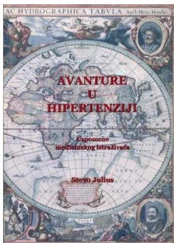
Stevo Julius: Avanture u hipertenziji : uspomene medicinskog istraživača; Samobor: A.G. Matoš, 2011